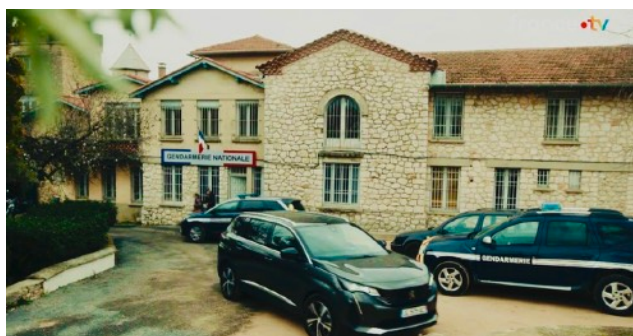
Le Collège transformé en 'Gendarmerie Nationale'. The Scots College transformed into a Police Station.

En 2025, le Collège des Ecosais a été un des décors de la série télévisée française « Meurtres à Millau » (avec Jean-Pierre Darroussin et Élodie Frégé). Si vous souhaitez découvrir le Collège dans ce nouveau rôle, vous pouvez regarder la série en direct ou en replay, en France et à l'étranger, en vous connectant à france.tv sur votre ordinateur (et bien sûr en France sur votre téléviseur).