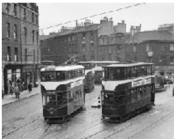
Anciens tramways / Old trams, Tollcross, Edimbourg

Professor would have liked that. He had a quiet admiration for the old trams. He also liked the colours of advertisements and shops. They were not quite the art of the art schools and he knew he was not supposed to like them. He was after all an active member of the Cockburn Society which was busy trying to protect the taste and appearance of the city. I have seen what he wrote about those trams. Your business, he would say, 'is not to think but to see'.